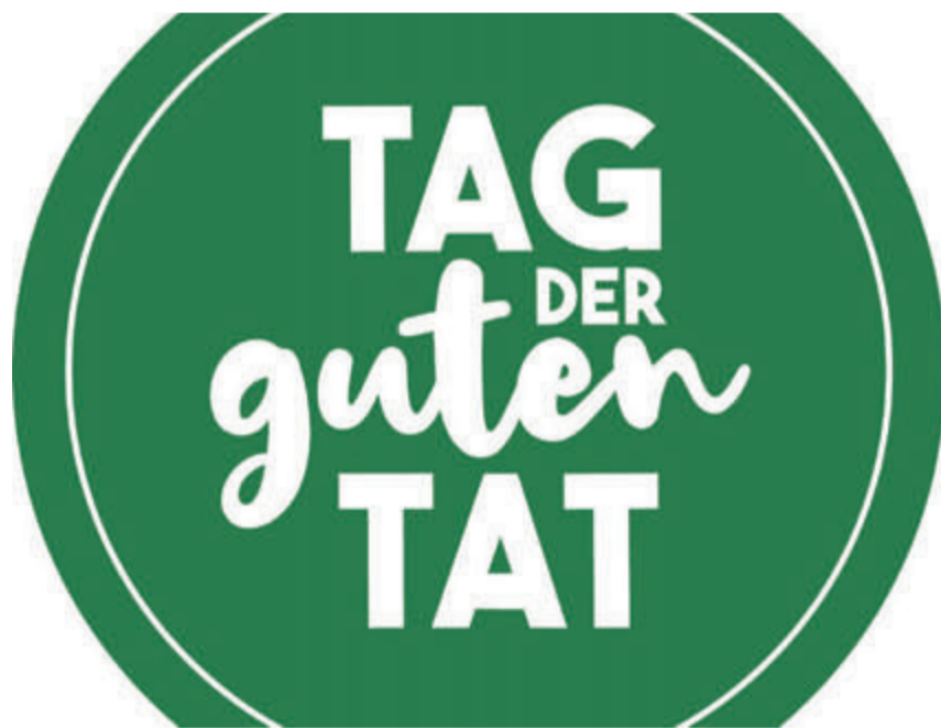
Am 21. Mai findet bei Coop der «Tag der guten Tat» statt.

Erneut sind das Schweizerische Rote Kreuz (SRK), der WWF Schweiz, die Schweizer Tafel, Tischlein deck dich, die Pfadibewegung Schweiz und Pro Infirmis die Hauptpartner des «Tag der guten Tat». Sie organisieren am Samstag, 21. Mai, rund 50 Mitmach-Aktionen in der Schweiz. Details zu diesen Mitmach-Aktionen finden Sie unter www.tag-der-guten-tat.ch/mitmachen .